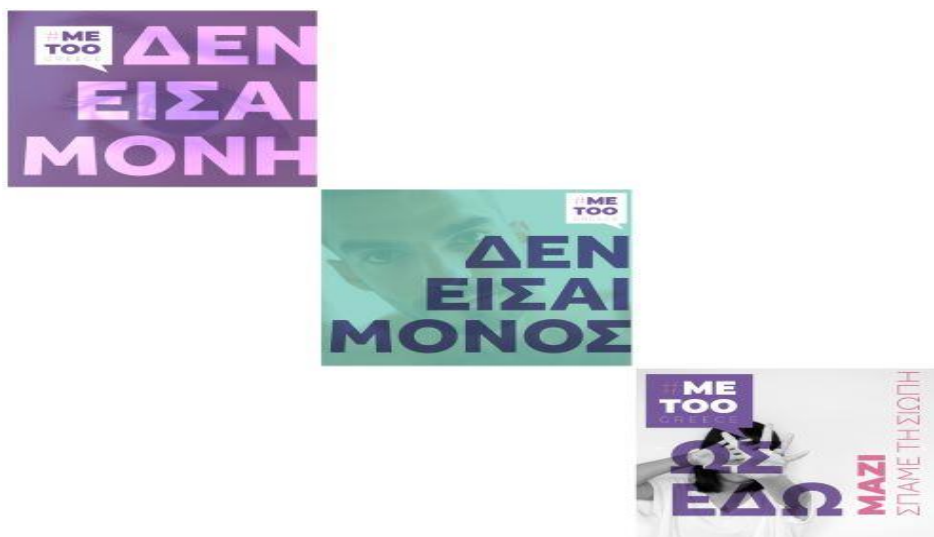
Εικόνα 3-Καμπάνια "Μαζί σπάμε τη σιωπή"

Στο ίδιο πλαίσιο το κίνημα Metoo, μέσα από την ιστοσελίδα του, προέβαλε την καμπάνια «Δεν είσαι μόνη», με την οποία προέτρεπε τα θύματα σεξουαλικής ή εξουσιαστικής βίας, να μιλήσουν και να καταγγείλουν. Η ιστοσελίδα είναι ένα εργαλείο της Πολιτείας στη διάθεση όλων των πολιτών και στόχο έχει την ενημέρωση και ευαισθητοποίησή τους για τα θέματα σεξουαλικής παρενόχλησης, κακοποίησης και εξουσιαστικής βίας, καθώς και για τις δράσεις αντιμετώπισής τους τους (Μαζί σπάμε τη σιωπή, 2022).