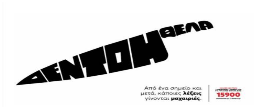
Εικόνα 2-Καμπάνια "Λέξεις-μαχαίρια"

Πρόσφατα, μάλιστα, το Υπουργείο Εργασίας και Κοινωνικών Υποθέσεων και η Γενική Γραμματεία Δημογραφικής και Οικογενειακής Πολιτικής και Ισότητας των Φύλων, παρουσίασε μια τέτοια δράση, την καμπάνια «Λέξεις μαχαίρια», στο πλαίσιο της οποίας απευθύνεται όχι μόνο στις κακοποιημένες γυναίκες, αλλά και στους θύτες και στο συγγενικό και ευρύτερο περιβάλλον τους τονίζοντας πως από ένα σημείο και έπειτα οι λέξεις των θυτών γίνονται μαχαιριές για τα θύματα. «ΑΚΟΥ τις Πράξεις και Όχι τα Λόγια». Αυτό πρέπει να υποδεικνύεται σε κάθε γυναίκα που βρίσκεται σε αμφιβολία αν αυτό που βιώνει είναι ο προθάλαμος της εισόδου σε κακοποιητικό περιβάλλον, που αμφιβάλλει ή που πιστεύει ότι μια βίαιη συμπεριφορά είναι τυχαία, αποσπασματική, και δεν μπορεί να επαναληφθεί (Συρεγγέλα, 2022).